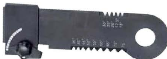
Calibre de muestra Ejemplo de muestra patentado.